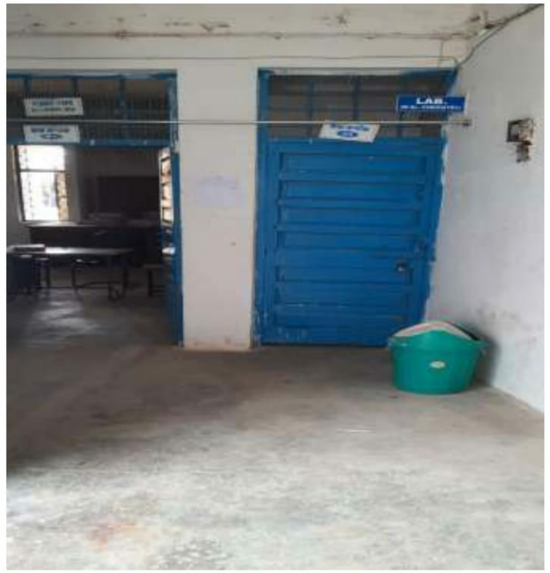
Photographs of Dustbins