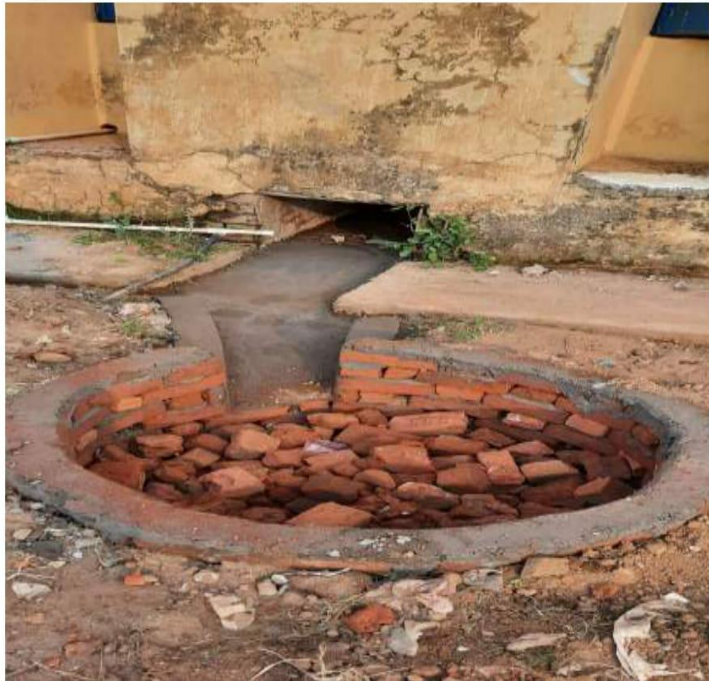
Soaking Pits in the college for waste water management